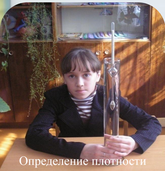
Определение плотности воды