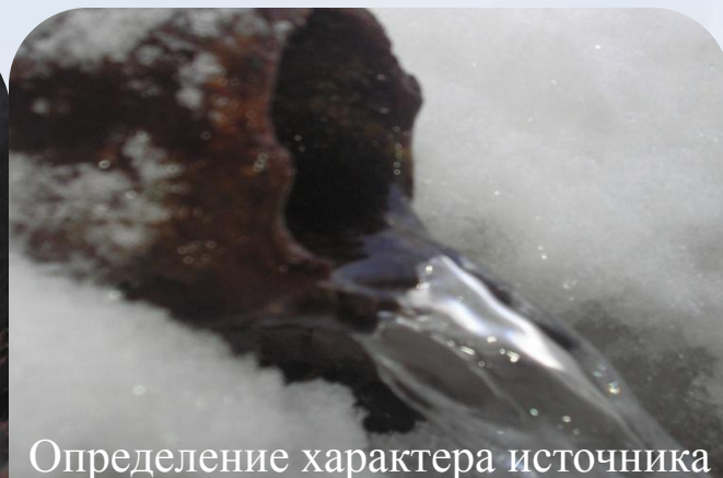
Определение характера источника