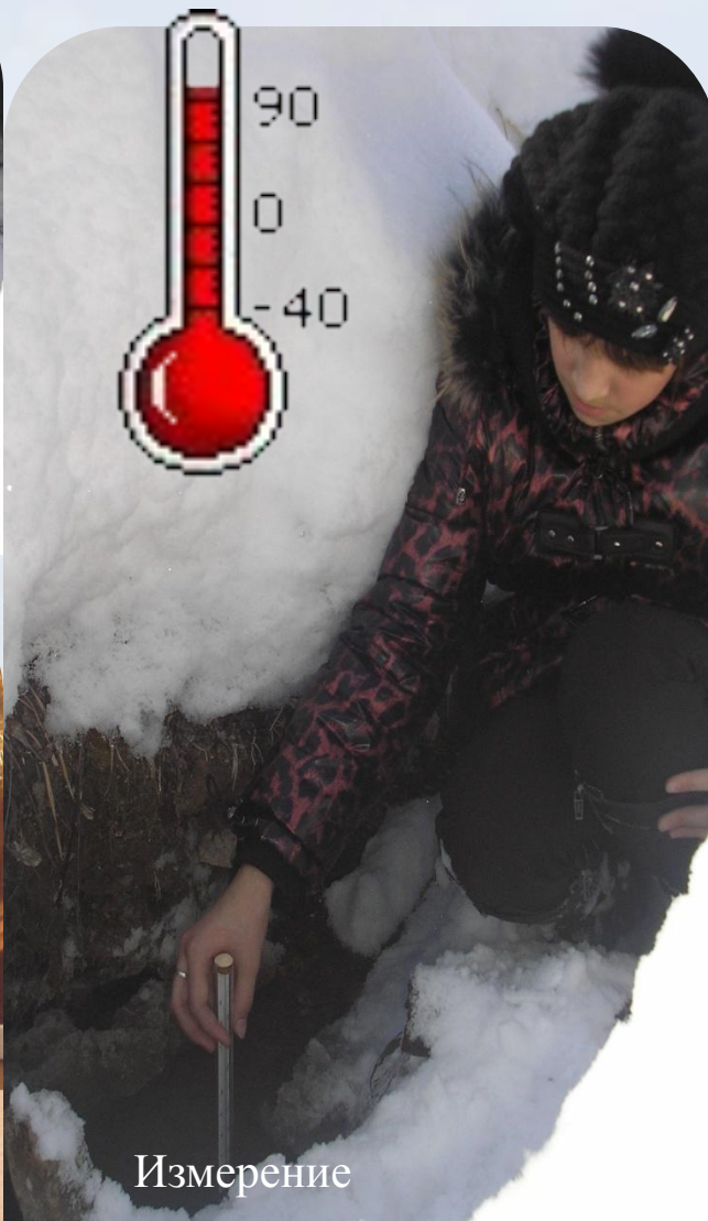
Измерение температуры воды