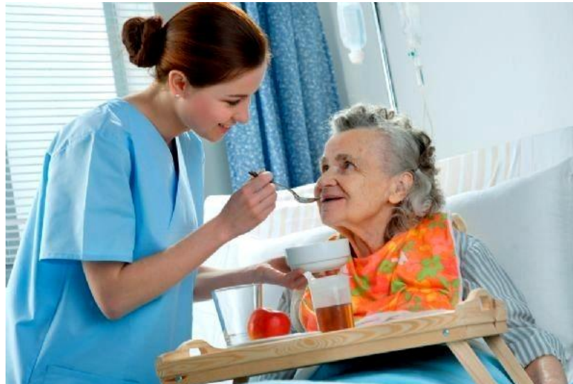
Осуществлять уход за пациентами