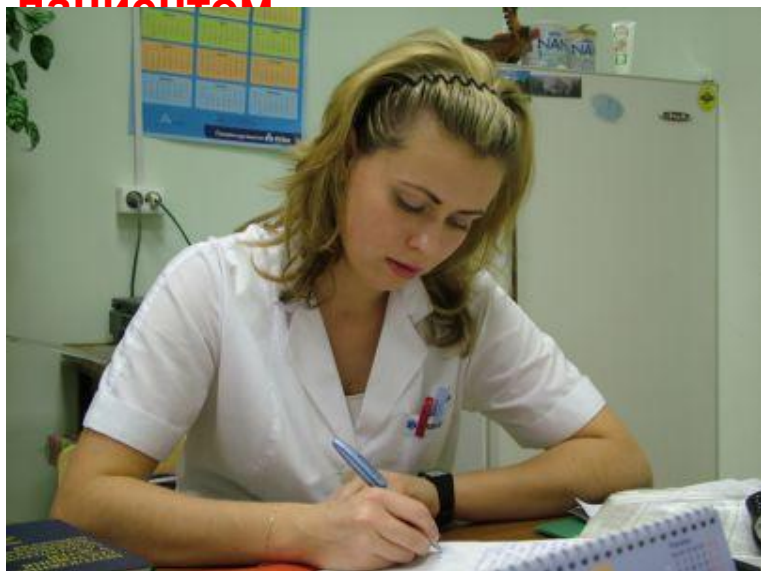
Заполнение медицинской документации