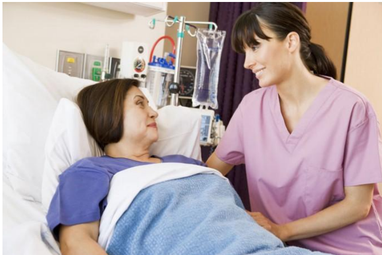
Эффективно общаться с пациентом