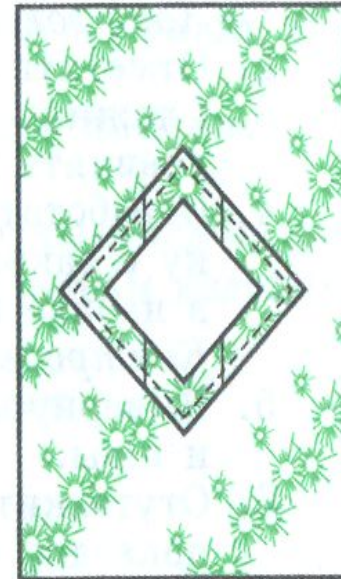
в виде ромба