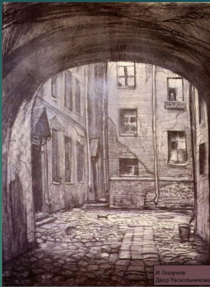
И. Глазунов Двор Раскольникова

Раскольников изображен в своей комнате. Каморка – последний штрих к его портрету. Здесь нет места человеку со здоровым сознанием. Тесная, узкая каморка Раскольникова „Достоевским поочередно сравнивается со шкафом, комодом, морской каютой и сундуком, а Пульхерией Александровной, матерью Раскольникова, – даже с гробом. Эта желтая каморка не просто является свидетелем "ужасных, диких и фантастических вопросов", которые зрели и накапливались в больном мозгу Раскольникова и которые он сам с собой, лежа здесь на диване, не раз "передумал, перешептал и переспорил"