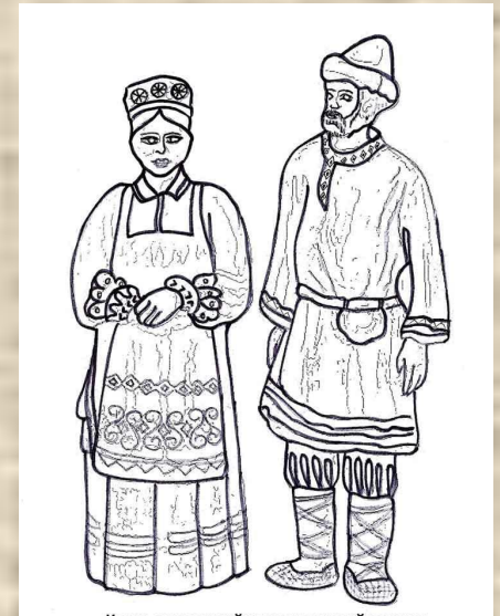
Коми-пермяцкий национальный костюм