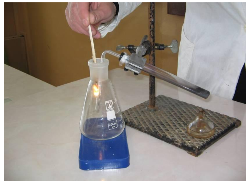
Проверка собранного кислорода