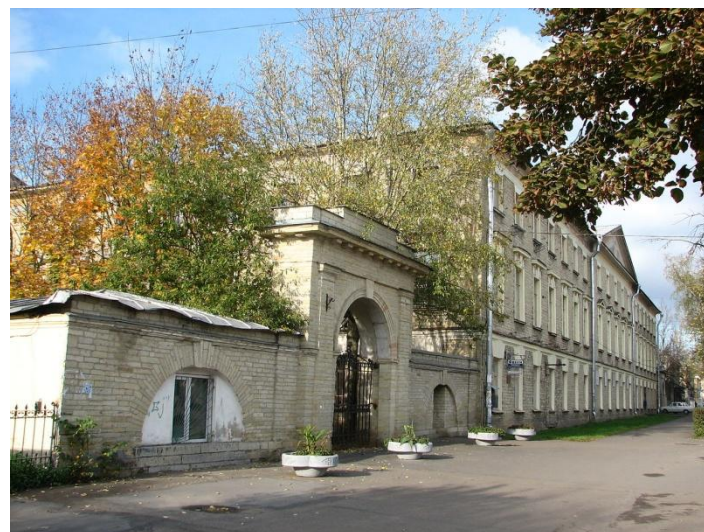
Гатчинский сиротский институт